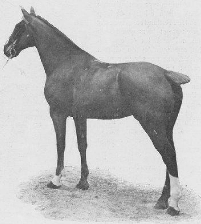
HUNTER IRLANDAIS DE L'ÉQUIPAGE SAINT-AUGUSTIN.