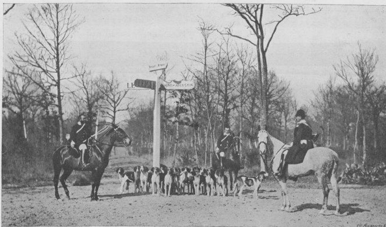
UN RENDEZ-VOUS EN FORÊT DE BRUMANCE.

qualités de cette vieille race dont les veneurs français étaient si fiers.