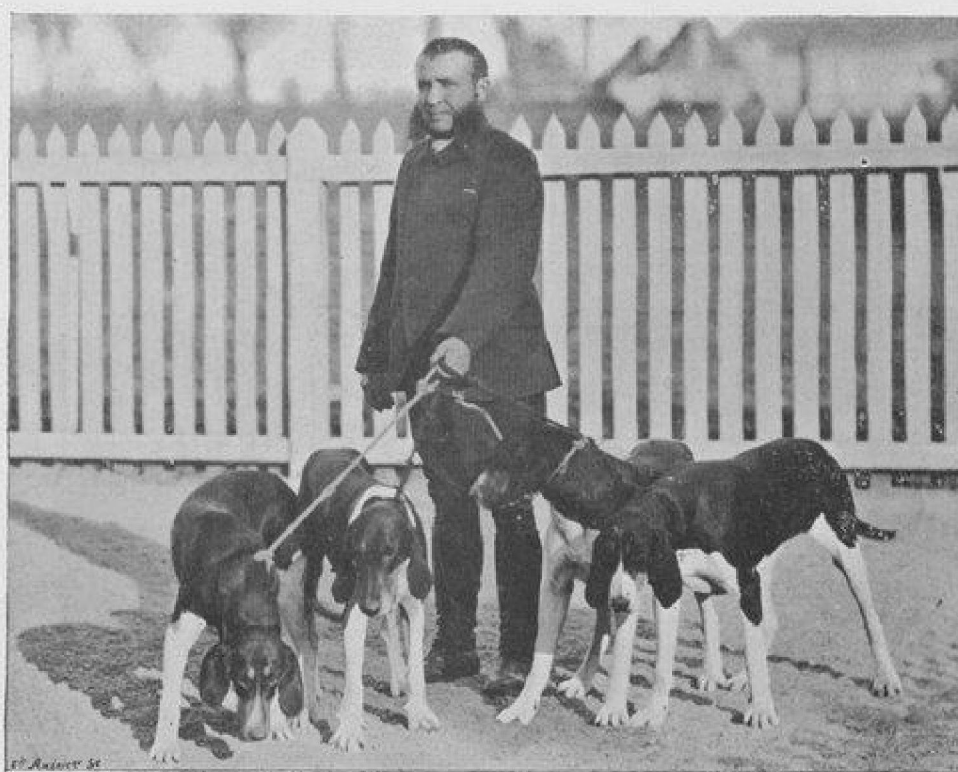
CHIENS DE L'ÉQUIPAGE DE SAINT-AUGUSTIN.