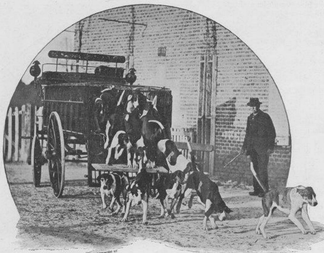
LES CHIENS SORTANT DE LEUR VOITURE POUR RENTRER AU CHENIL.

Un exemple de la finesse de nez et de l'intelligence de cette