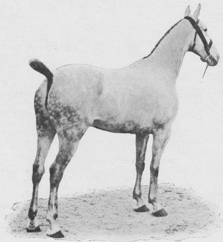
FANNY, HUNTER DE L'ÉQUIPAGE SAINT-AUGUSTIN.

Le lot des hunters de Saint-Augustin est un des plus beaux qui se puisse voir en France surtout dans un équipage de